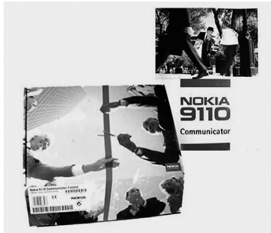
Kuva 2. Kommunikaattorin pakkaus ja ohjekirja

Kommunikaattorin paketin ja ohjekirjan kansikuvassa esiintyi kaikkiaan 14 ihmistä, joista 10 miestä ja 4 naista. Seitsemällä miehellä oli musta puku, lopuilla harmaa; kaikilla naisilla on joko musta tai harmaa liike-elämälle tyypillinen jakkupuku. Paketin kuvassa vihittään jotain laitosta, tietä tai taideteosta. Ihmisten ilmeet ovat iloisia ja arvostavia. Nauhaa parhaillaan leikkaavalla miehellä on